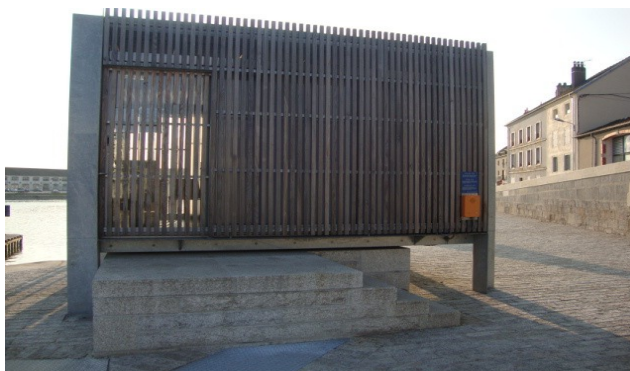
téléphone SOS externe, situé en façade de la cabine de l'écluse de Gray

Si vous êtes à proximité, les écluses suivantes sont joignables par téléphone ou VHF sur la Saône petit gabarit :